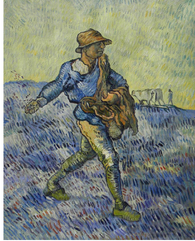
Vincent van Gogh / The Sower / 1889 80.8 x 66.0 cm

Vaizlikten kopuş onun yönünü iyiden iyiye sanata çevirmesini sağladı. Van Gogh, Jean François Millet'yi çok seviyordu, Fransız Barbizon ekolünün öncü ismi Millet'yi. Onun resimlerinde ken-dinden parçalar buldu, Tohum Eken Adam/Ekici resmini beş kez kendi çizgileriyle yeniden yaptı.