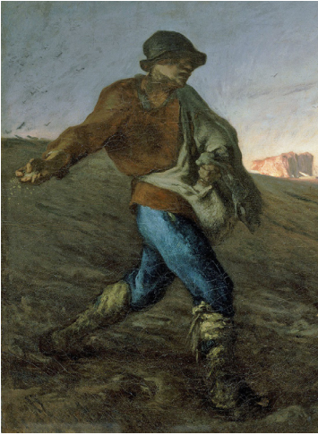
Jean-François Millet / The Sower / 1850 105 x 86 cm

Belçika'ya vaiz olarak gönderdikleri Van Gogh, değişmişti, ki-liseye gitmiyordu artık. Tanrı'yı sorgular gibi laflar ediyordu, bu durum eski rahip olan babasını çok rahatsız etti.