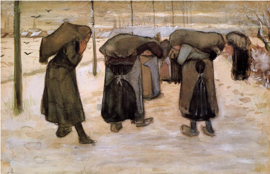
Vincent van Gogh / Kömür Taşıyan Kadın Madenciler / 1882 Kröller-Müller Museum Netherlands 32 x 50 cm

Onlara “Yaşamınız acıklı, bu hayatta çok çekiyorsunuz, sizler Tanrı'nın kutsadığı kişilersiniz”, “Bizim yaşamımız dünyadan cennete