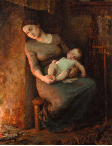
Virginie Demont-Breton L'homme est en mer / The Man is at Sea 161 x 134,5 cm