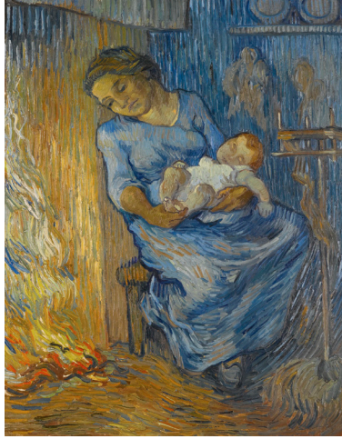
Vincent van Gogh / 1889 66 x 51 cm

Burada soldaki resim 19. yüzyılın ünlü Fransız realist ressamı Jules Breton'un kızı Virginie Demont-Breton'a ait. Sağdaki resim ise fırça vuruşlarından belli olacağı üzere Van Gogh. Van Gogh hoşuna giden resimleri yeniden kendi tarzıyla çalışmaktan çekinmiyordu, bu çalışmalar onun için kabul görmüş eserler üzerinden pratik yapma imkânı sağlıyor, diğer taraftan bu eserlere bir çeşit saygı duruşunda bulunuyordu. Öncelikle Millet'nin onlarca resmini yorumladı, sonrasında ilk akla gelenler Rembrant'ın ( The Raising of Lazarus ) Lazarus'un Yükselişi ve V. D. Breton'un üstteki resmidir. Breton resmine tarih atmamış ama yapım tarihinin Van Gogh'un çiziminden önce olduğu biliniyor. Kendisinden önceki sanatçıların kimi eserlerini yeniden yorumlamak Picasso'dan Dalí'ye sanat tarihi içerisinde sıklıkla karşılaştığımız bir durumdur.