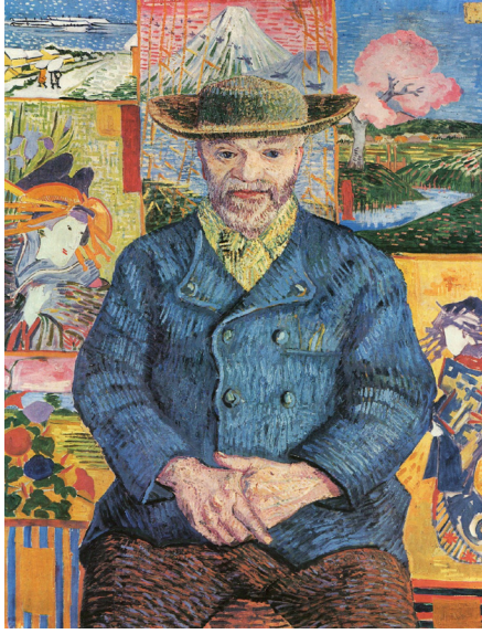
Vincent van Gogh / Père Tanguy'un Portresi / 1887 / 65.0 cm x 51.0 cm Musée Rodin, Paris

1887'de Pere Tanguy portresini yaptı: Baba Tanguy . Tanguy'un resminin fonunu Japon desenleriyle tamamladı. Van Gogh, eline geçen tüm Japon baskıları biriktiriyor, Japon sanatına büyük ilgi duyuyordu.