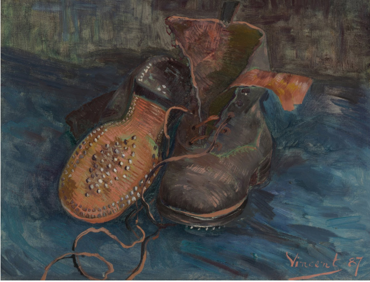
Vincent van Gogh / Bir Çift Bot / A Pair of Boots / 1887 / 32.7 x 41.3 cm The Baltimore Museum of Art

Ertesi gün Van Gogh bazı resimlerini alıp Tanguy'un salonuna gitti, orada Cezanne ve Gauguin ile karşılaştı. Cezanne, modern resmin babasıdır. Picassodan soyut sanatlara birçok sanatçıyı etkilemiş önemli bir isim. Cezanne belki de o zamana kadar Van Gogh ismini hiç duymamıştı, resimlerine baktıktan sonra "Doğrusunu isterseniz pek beğenmedim, bunları sanki bir deli yapmış gibi" dedi. Van Gogh üzüntüyle karışık bir şaşkınlık yaşadı, götürdüğü resimlerden biri Botlar'dı , resminde yaşam ve ölüm arasındaki uzun yolculuğu anlatmıştı ama orada bulunanlara anlamsız geldi. Alışılmış resmin dışında bir şeydi bu. Cezanne bile onu anlamamıştı. H. E. Gombrich "Beğeni tartışılmaz ama geliştirilebilir" der. Belki Cezanne'nin (bile) o günkü beğeni düzeyi çağın ilerisindeki bir sanatçının eserlerini beğenecek düzeyde değildi kim bilir. Şunu da belirtelim sonradan Cezanne ile birlikte 20. yüzyıl sanatını derinden etkileyen iki isimden biri olacak kendisi.