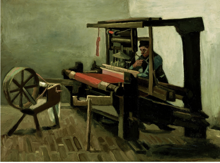
Vincent van Gogh / Dokumacı / Weaver / 1884 62.5 x 84.4 cm Avenue of the Arts / Boston

Yaş 31 olmuştu, düşünün bu insan 37 yaşında öldü, hâlâ ortada bir şey yok. Resme çok geç başladı, çok geç ve ne yazık ki çok kısa yaşadı. O dönem sıklıkla Hollanda'daki evinin yakınında bulunan dokumacıları gezip onları gözlemliyordu. Van Gogh'un çalışan fakirlere karşı duyduğu hisler onun ilk ciddi eserlerinin konusunu oluşturdu, dokumacıların yaklaşık otuz adet çalışmasını yaptı.