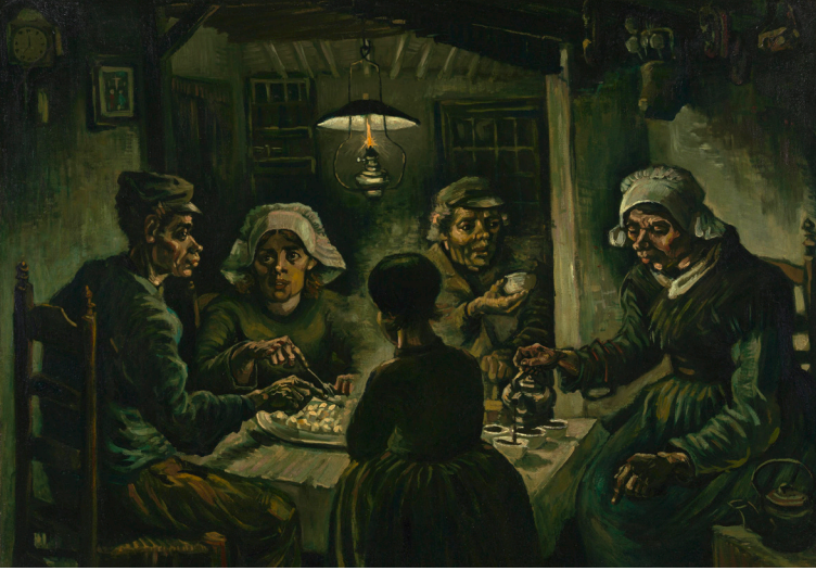
Vincent van Gogh / Patates Yiyenler / The Potato Eaters / April-May 1885 Van Gogh Museum / Amsterdam

Paris'e geldiğinde hayatını değiştirecek çok önemli bir keşif yapıp, Charles Blanc'ın tamamlayıcı renk teorisini benimsedi. Renkleri birbirini tamamlayıcı bir şekilde kullanıyordu, mor ve sarı, mavi ve turuncu veya yeşil ve kırmızı gibi.