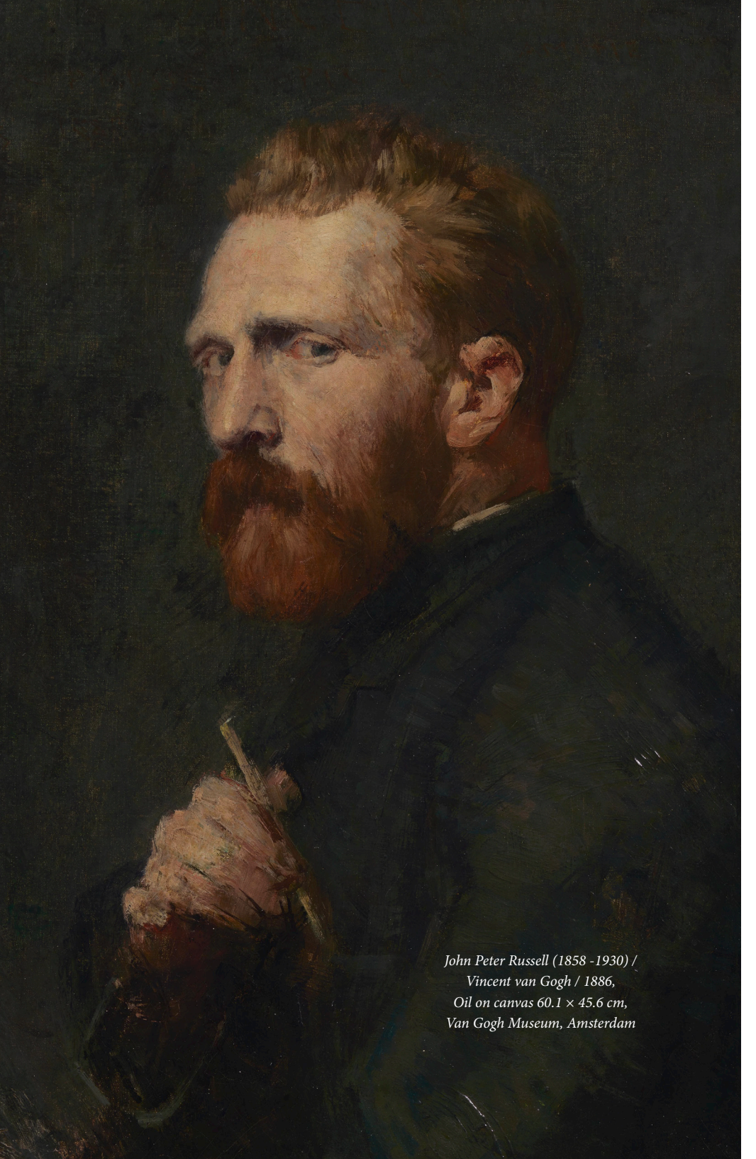
John Peter Russell (1858 -1930) / Vincent van Gogh / 1886, Oil on canvas 60.1 × 45.6 cm, Van Gogh Museum, Amsterdam