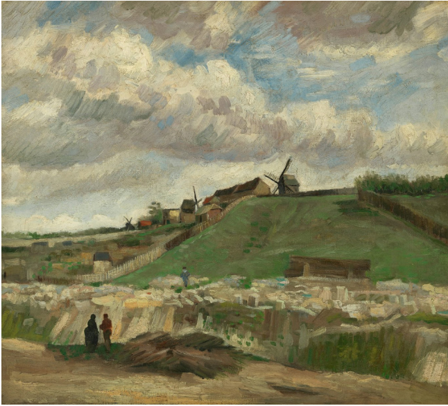
Vincent van Gogh / Montmartre ve Taş Ocağı / 1886 Van Gogh Museum, Amsterdam

Bir gün kendisini denetlemeye gelen kişiler onu derme çatma bir evde buldular. Bu durumun Kilise'nin imajını zedelediğini söylediler. Van Gogh da “Onlar gibi yaşamazsak Tanrı'nın mesajını iletemeyiz” dedi. Bu onlar için alışılmış bir üslup değildi, çizilen yolun dışına çıkması hoş karşılanmadı. Velhasıl kelam vaizlik görevine son verildi. Aşırı hareketleri vardı, fazla heyecanlıydı. Yaş 27-28, ömrünün sonuna 9 yıl var, hâlâ bildiğimiz Van Gogh değil. Yaptığı doğru düzgün bir tane resim yok.